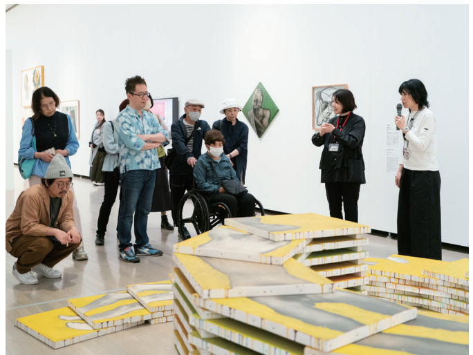
手話通訳付きギャラリートーク