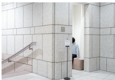
カームダウン・クールダウンスペース