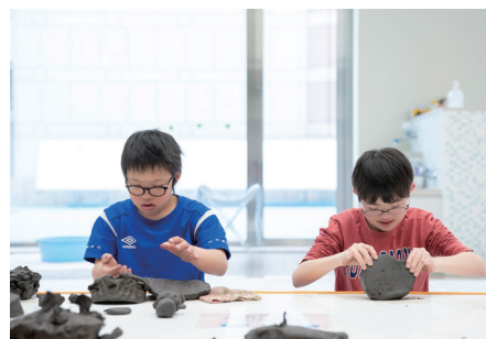
のびのび造形じかん

12歳以下を対象とした創造の場である「子どものアトリエ」では、2つのアクセスプログラムを開催。「はじめての造形あそび」は未就学児とその保護者を、「のびのび造形じかん」は個別支援学級や特別支援学校に通う小学生とその家族を対象としています。詳細は裏面「申込方法」欄のQRコードからご覧ください。