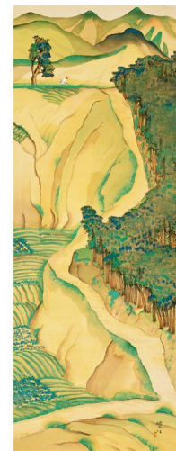
《潮見坂》 絹本着色・一幅 大正4年（1915） 112.5×42.0 cm 横浜美術館

再興日本美術院の中心的存在となった紫紅は、後輩たちを導き、日本画の革新に尽くしました。理想と考えたのは、若い画家が生活に困ることなく、自由快活に、描きたい絵を追求できること、すなわち「 インキ 暢気に描け」る環境でした。後輩たちとの研究会「赤曜会」は、その実践の一つでした。一方で自らは、古臭いものとされていた江戸時代の「南画」を再評価し、「新南画」ともいべき作風を展開しつつありました。池大雅や富岡鉄斎の生気ある絵に新味を見出し、彼らが学んだ明清絵画の研究にも打ち込みました。さらにこの時期の作品には、同時代の西洋絵画の影響もうかがえます。この章では、老成をも感じさせる晩年の紫紅の画境の深まりを探ります。