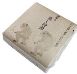
塩瀬総本家 蒸し饅頭 1,350 円 (税込)