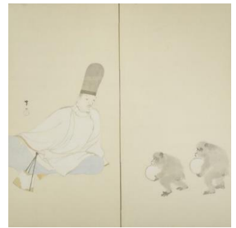
《鞠聖図》紙本着色・二曲屏風一隻 明治44年（1911） 147.4×145.6 cm 横浜美術館

明治13年（1880）、今村紫紅は横浜の提灯問屋に生まれました。17歳で上京し、歴史画の大家の松本楓湖に入門します。師のもとで粉本（古典的な画題や筆法を習うための手本）を徹底的に模写し、郊外の写生にもつとめ、本格的に日本画の修行をはじめました。ほどなく、創立まもない日本美術院の展覧会で賞を得るなど、歴史画の分野で頭角をあらわします。この章では、模写などを通して「古画のよい処」を吸収しつつ、新しい歴史画の開拓をめざした青年期の模索の様子をたどります。