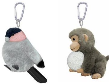
ふわもこチャーム 各 2,200 円 (税込)

紫紅の作品に登場する、幸運の鳥「ウソ」と鞠を抱いた鞠の精の「さる」のふわもこチャームや、老舗菓子店《塩瀬総本家》とコラボした、展覧会限定パッケージの蒸し饅頭と最中が登場します。お土産にもおすすめです。