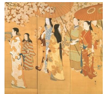
《護花鈴》 絹本着色・六曲屏風一双（図は部分） 明治44年（1911） 各170.2×364.4 cm 霊友会妙一コレクション （展示期間：4月25日～5月8日）

日本美術院の有望な若手メンバーとなった紫紅は、創立者の岡倉天心の教えや、先輩画家の横山大観、下村観山、菱田春草らの制作に大きな刺激を受けます。いち早く俵屋宗達などの琳派や、中国の明清時代の古画にも着目し、創作の幅をひろげていきます。また文展に出品した《護花鈴》が、桃山文化に傾倒していた横浜の実業家・原三溪の目にとまり、三溪の支援が決まります。この章では、三溪の力強い援助を得た紫紅が、古画の本質を見極めて、さまざまな主題に取り組み「多方面に」描いた作品を紹介します。