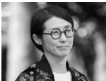
乾 久美子 いぬい・くみこ

設計者・丹下健三が使った御影石に埋め込まれているさまざまな色を抽出し、オリジナルの什器をつくりました。横浜美術館の特徴である巨大な天窓が修復されたことをいかし、自然光の下で石の色と什器がお互いに引き立てあい、和らいだ雰囲気漂う場所を目指しました。入ってすぐ正面の「まるまるラウンジ」にはいろいろなサイズのテーブルと椅子を揃え、ひとりでも、みんなでいても居場所と感じられる場所になればと考えました。また、ユニット化した什器はシーンにあわせて組み合わせが変えられるようになっていきます。什器の制作にあたっては、さまざまな障がいのある方たちと共にインクルーシブワークショップを実施しました。原寸大のモックアップを試しながら知見を得るといった貴重な機会がなければ生まれなかった家具もありますので、オープンを楽しみにしてください。