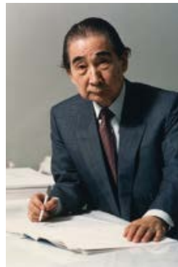
丹下健三（1986年）