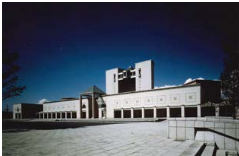
開館間もないころの横浜美術館

1913年大阪生まれ。1938年東京帝国大学（現・東京大学）工学部建築科を卒業。ル・コルビュジエに傾倒しその教え子である前川國男の建築事務所に入る。1941年同大学大学院に入学。卒業後、1946年から1974年まで母校で教壇に立ち、1987年には建築界のノーベル賞とも言われるプリツカー賞を日本人として初めて受賞した。2005年3月没。代表作に、広島平和記念資料館、香川県庁舎、国立代々木競技場、東京都庁舎など。