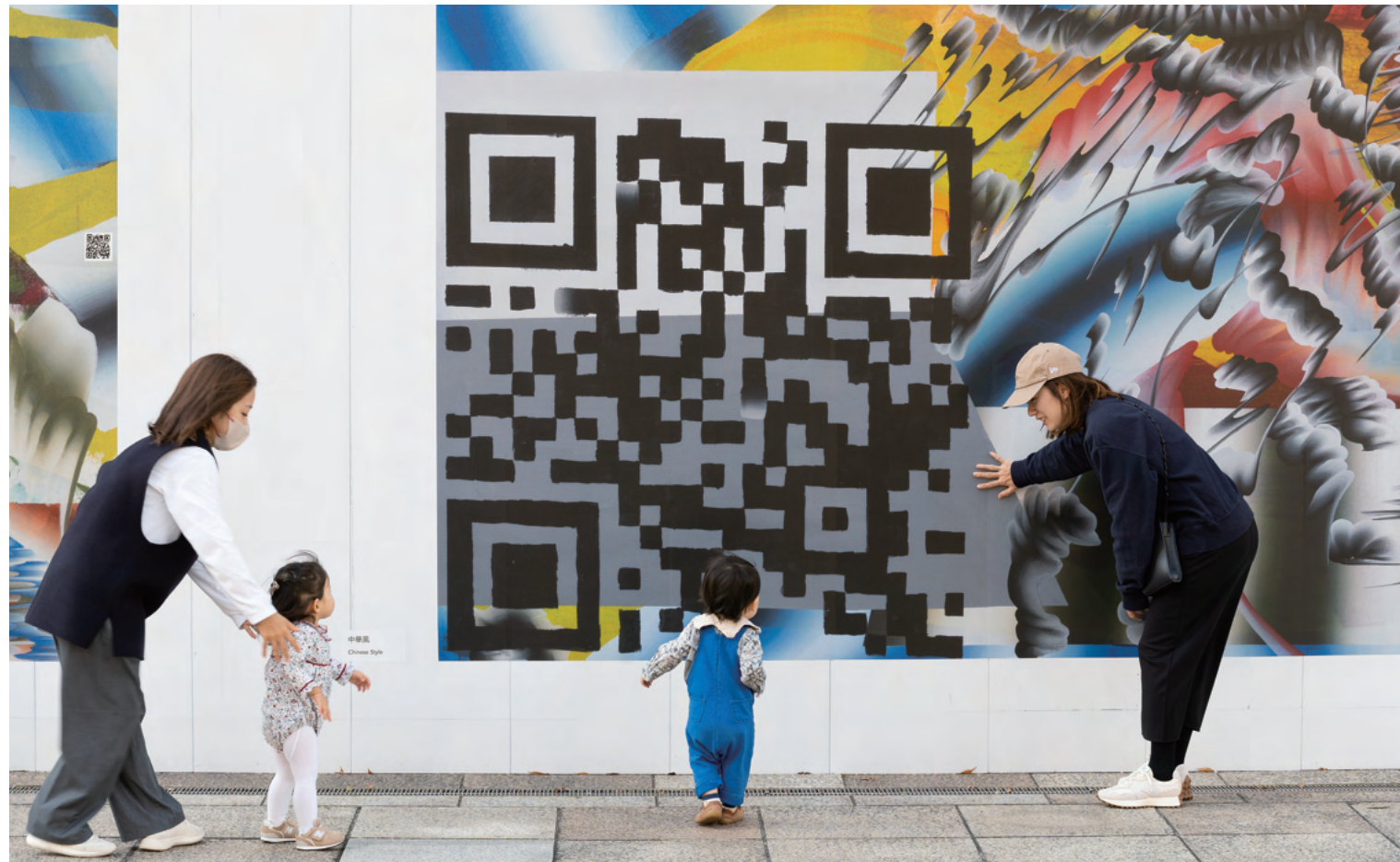
左 上から《雲と海》、《窓と壁》、《中華風》 右 掲出風景