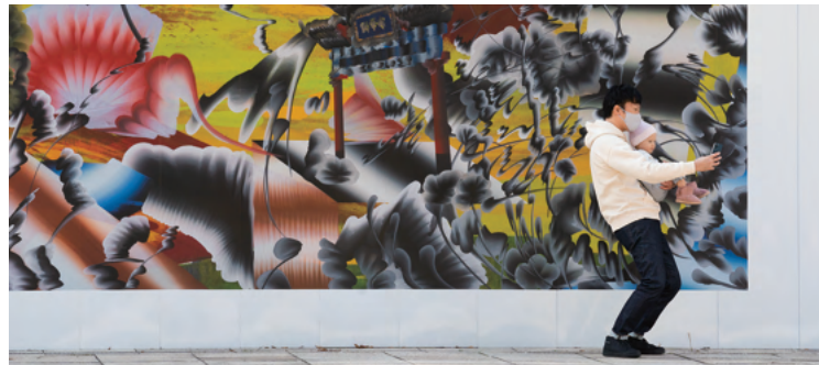
左上から《仮囲い》、《小龙虾》 ほか 掲出風景