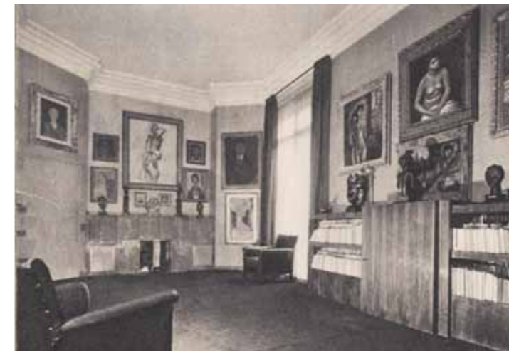
フォッシュ通りのギヨーム邸宅の様子（1932年頃）

オランジュリー美術館所蔵品の核をなす「ジャン・ヴァルテル&ポール・ギヨーム コレクション」は、ヨーロッパの中で最も質の高い印象派とエコール・ド・パリの作品群のひとつ。