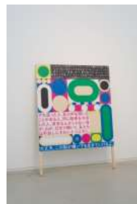
詩：最果タヒ グラフィック：佐々木俊 《詩の標識、 あるいは看板（坂道の詩）》 2018 年 作家蔵