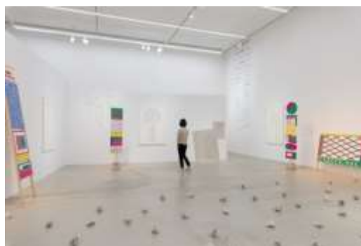
本と美術の展覧会 vol.2 「ことばをながめる、ことばとあるく ——詩と歌のある風景」 （太田市美術館・図書館、2018 年） インスタレーションビュー