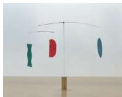
(参考図版) Café 小倉山の展示予定作品