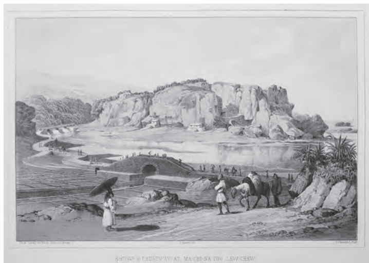
挿図9 ハイネ&ブラウン《琉球マチナトウ[牧港]の橋と土手》 石版画 挿絵【1】p.184 画像番号4319

⑭従軍牧師のジョーンズ師は、提督の命令でテイラー氏とハイネ氏とともに、この老人(補足：探検と首里