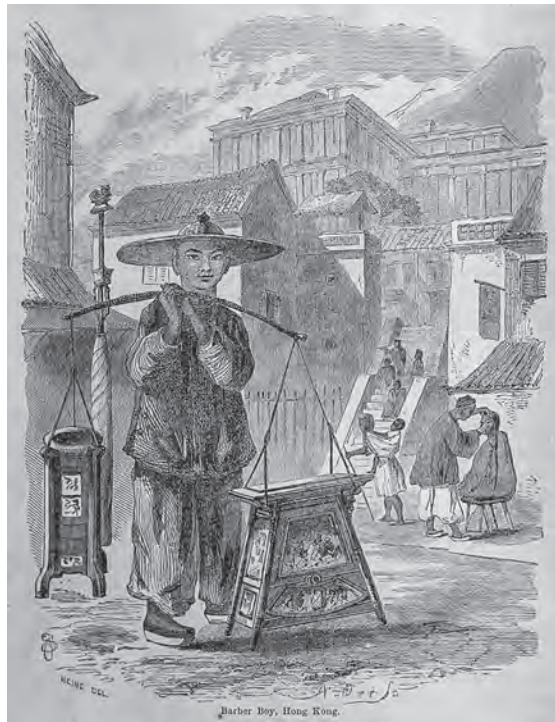
挿図14 ハイネ《香港の少年理髪師》木版画 挿絵【1】p.134 画像番号4286

③(補足：西之島)ディサポイントメント島とロザリオ島は同一の島と思われる。乗り組み士官の航海観測に加え、画家がこの島の外観を描いているので、付録[原書の第二巻]に載せておく。