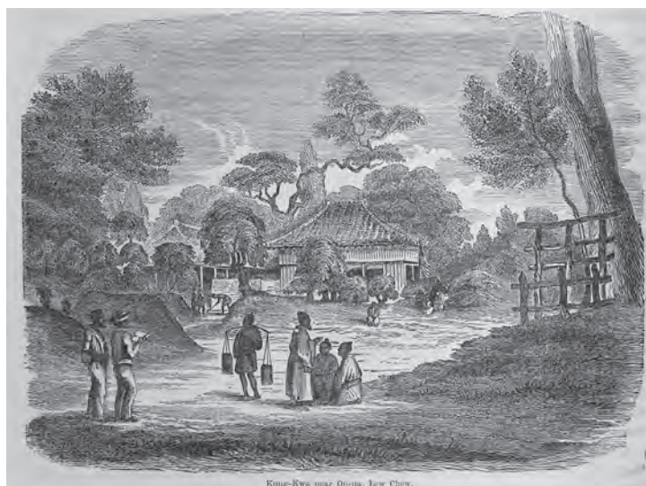
挿図3 ハイネ&ブラウン《琉球ウーナ[恩納]近くの公館》木版画 挿絵【1】p.180 画像番号4317

3点目は、場所は琉球の恩納、画面左下に2人の人物が描かれている。右に立つ人物が筆記具を持ってスケッチしているようだ。