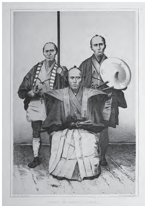
挿図6 ブラウン《箱館の奉行あるいは監督官》 石版画 【1】p.432 画像番号4427

ブラウンの挿絵に特徴的なのは、ブラウンが撮影した銀板写真をもとにした挿図6《箱館の奉行あるいは監督官》のような肖像画である。