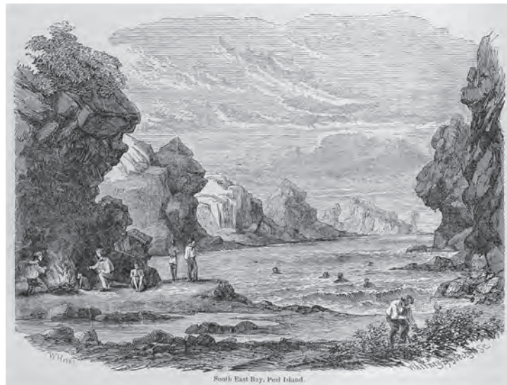
挿図10 ハイネ《ピール島の南東湾》木版画 挿絵【1】p.208 画像番号4332

【2】【3】p.204【4】p.454(上)：第10章ボニン(小笠原)諸島の踏査