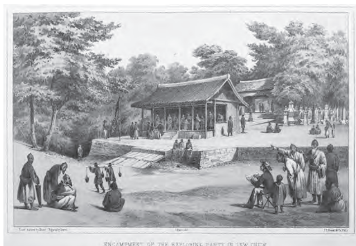
挿図2 ハイネ&ブラウン《琉球踏査隊の宿营地》石版画 挿絵【1】p.176 画像番号4315 ※画像番号については3-2を参照

次は、画面下のほぼ中央で絵を描いている後ろ姿である。場所は下田、周囲を日本人に囲まれ、見物に集まってくる子どもたちを追い払っている役人の姿もある。(図版10)