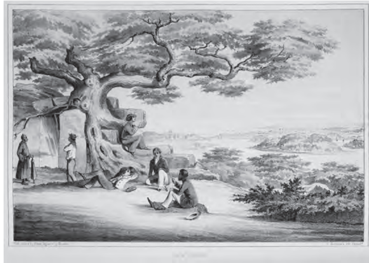
挿図15 ハイネ&ブラウン《琉球》石版画 挿絵【1】p.280 画像番号4355

⑥(補足：函館訪問に際して)一中略一当局は提督、士官、遠征隊の画家のそれぞれに宿舎として三軒の家または寺院を用意すること、この地方で供給できる物資を一定の価格表に従って艦隊に提供すること、また必需品だけでなく、アメリカ人が好奇心や興味を抱きそうな蝦夷の産物や博物学的標本も提供することを要求し、それに対しても正当な対価を支払うと述べた。