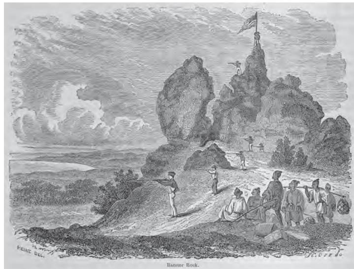
挿図7 ハイネ《バナー・ロック》木版画 挿絵【1】p.168 画像番号4307