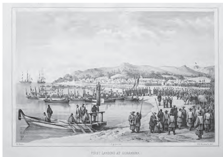
挿図5 ハイネ《久里浜に初上陸》石版画 挿絵【1】p.256 画像番号4348

挿絵の特徴としては、遠方にまで広がる風景を感じさせるような空間を描き、そこにいる人々の様子を含めて、その場所に立ったら見えるであろう近景から遠景までの広がり描き入れられている。具体的には、挿図5《久里浜に初上陸》が最遠景に描かれている富士山が図版では見にくいですが、その典型例である。