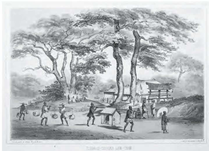
挿図8 ハイネ&ブラウン《琉球のチャングコサ [山田越し、喜名番所]》石版画 挿絵【1】p.182 画像番号4318

⑫(補足：深い溪谷で)海に向かって古い時代の墳墓が五つ六つ立っていた。ある岩層の下からは清水がほとぼしっていた。ハイネ氏は、この、静けさと絵のような美しさが際立つ場所をスケッチした。島民たちは、その川を「フィジャ」[比謝川]と呼んでいた。