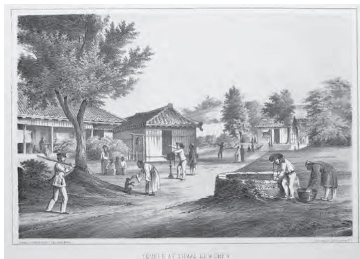
挿図4 ハイネ&ブラウン《琉球、泊村の寺院》石版画 挿絵【1】p.194 画像番号4326

次はブラウンの姿を紹介したい。場所は琉球の泊、画面中央にいるのがブラウンとされ 8 、箱型のカメラを立て、銀板写真を撮影している姿である。写真を撮影するブラウンの姿はこの1点のみであった。