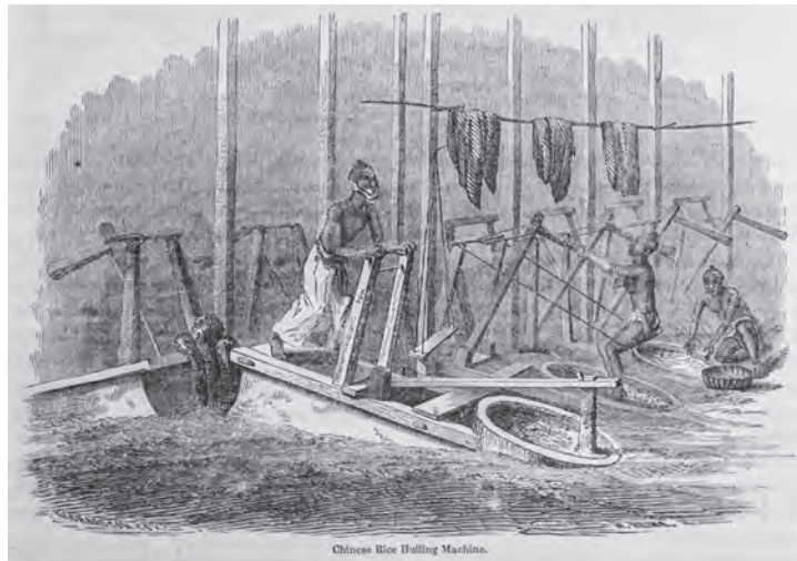
挿図16 ハイネ《中国の舂摺り機》木版画 挿絵【1】p.507 画像番号4466