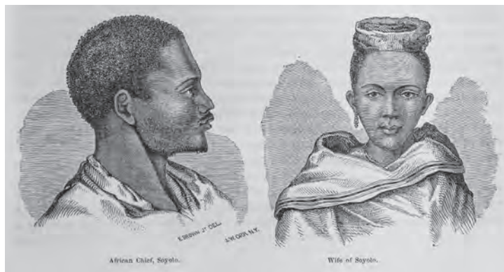
挿図12 ブラウン《アフリカ人酋長ソヨロ(左)ソヨロの妻(右)》 木版画 挿絵【1】p.102 画像番号4265_2

ブラウンについての記述は、ハイネよりもかなり少ない。【1】挿絵リストに《Kaffir chief “Seyoro” and wife - from life》とあり、「from life」という記載から実物を描いたとされる 21 。また、本文の記述にもブラウン自身が実際に会って描いたとある。