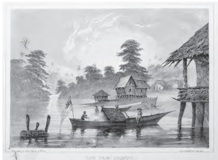
挿図13 ハイネ&ブラウン《シンガポールのドゥロング河》 22 石版画 挿絵【1】p.130 画像番号4283