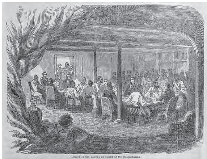
挿図11 ハイネ《摂政を招いたサスケハナ艦上での宴会》木版画 挿絵【1】p.216 画像番号4337