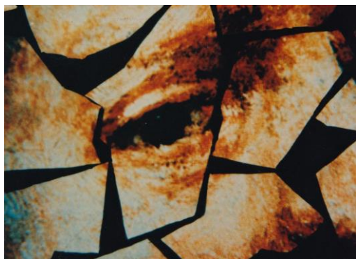
《変形作品第5番<レンブラントの主題による変形解体と再構成>》 黒坂圭太/1986年 ※5/30(土)16:00～(横浜特別講座1)にて上映