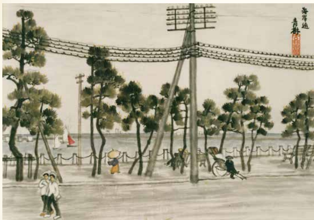
小茂田青樹《横浜海岸通り》1915（大正4）年 紙本着色、軸 31.1×47.6cm 横浜美術館蔵