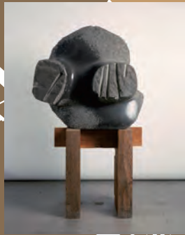
イサム・ノグチ〈捜査者、探し出した〉 1969年、玄武岩、94.0×109.6×49.8cm、 イサム・ノグチ財団・庭園美術館（ニューヨーク）蔵 ©The Isamu Noguchi Foundation and Garden Museum/New York/ARS-JASPAR Photo:Kevin Noble