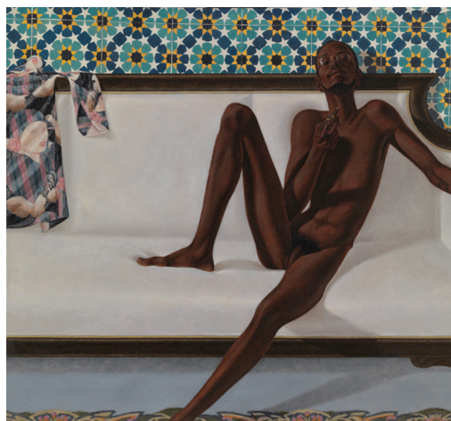
7 バークレー・L・ヘンドリックス 《ファミリー・ジュールス:NNN[ノー・ネイキッド・ニガー(裸の黒人は存在しない)]》