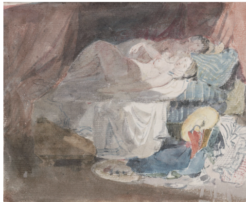
5 ジョゼフ・マロード・ウィリアム・ターナー 《ベッドに横たわるスイス人の裸の少女とその相手》 「スイス人物」スケッチブックより