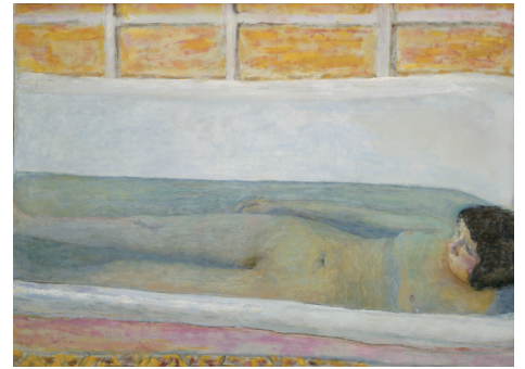
3 ピエール・ボナール 《浴室》