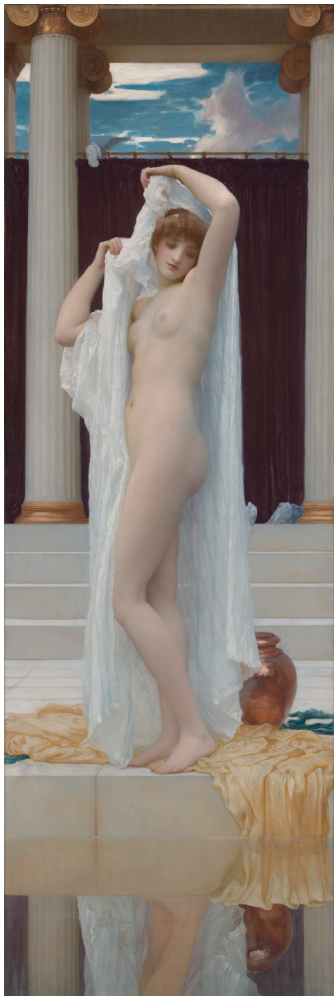
4 フレデリック・ロード・レイトン 《プシケの水浴》