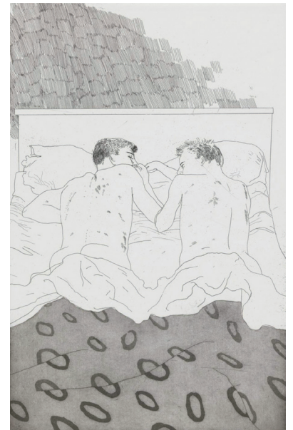
6 デイヴィッド・ホックニー 《23,4歳のふたりの男子》 C.P. カヴァーフィスの14編の詩のための挿絵より