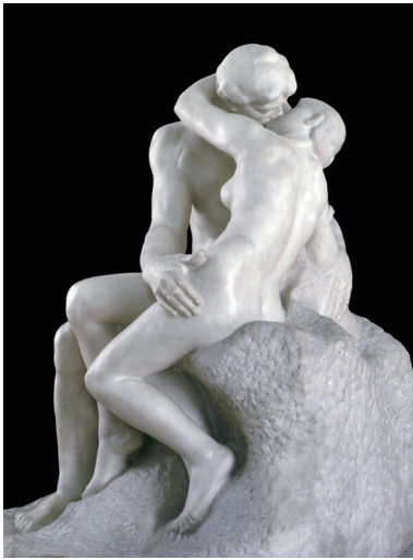
1 オーギュスト・ロダン 《接吻》(部分)