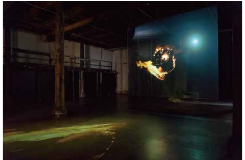
アピチャップン・ウィーラセタクン《炎(扇風機)》 2016年、シングル・チャンネル・ビデオ・インスタレーション

日本での主な作品発表 「さいたまトリエンナーレ2016」、「アピチャップン・ウィーラセタクン 亡霊たち」東京都写真美術館(2016年)