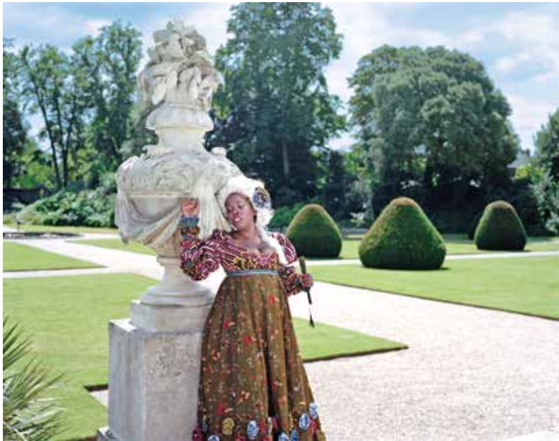
インカ・ショニバレ MBE《さようなら、過ぎ去った日々よ》 2011年、シングル・チャンネル・ビデオ Courtesy the artist and James Cohan Gallery, New York

本展で紹介するのは、人間の身体や集団としての行動、超自然的な存在など、歴史を通じて作り上げられた身体が生み出すイメージの数々をモチーフに、それぞれの角度から作品化していく現代の作家たちの作品です。