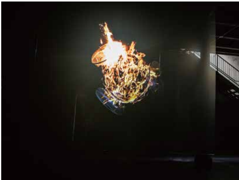
アピチャポン・ウィーラセタクン《炎（扇風機）》 2016年、シングル・チャンネル・ビデオ・インスタレーション

肌の色、民族や宗教、性差や生活のスタイルまで、さまざまな違いのある人々が同居する世界では、個々の身体が持つ色や形状、振る舞いなど、本来特定の意味などなかったはずのものに長い時間の中で価値の差別化が生じ、不幸な歴史へと繋がったことも少なくありません。