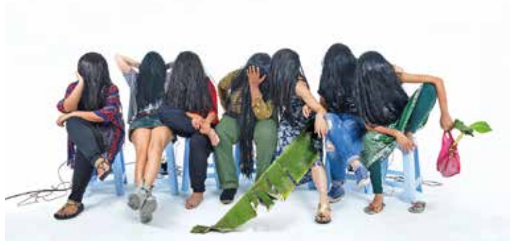
上：イー・イラン《ポンティアナックを思いながら：曇り空でも私の心は晴れ模様》