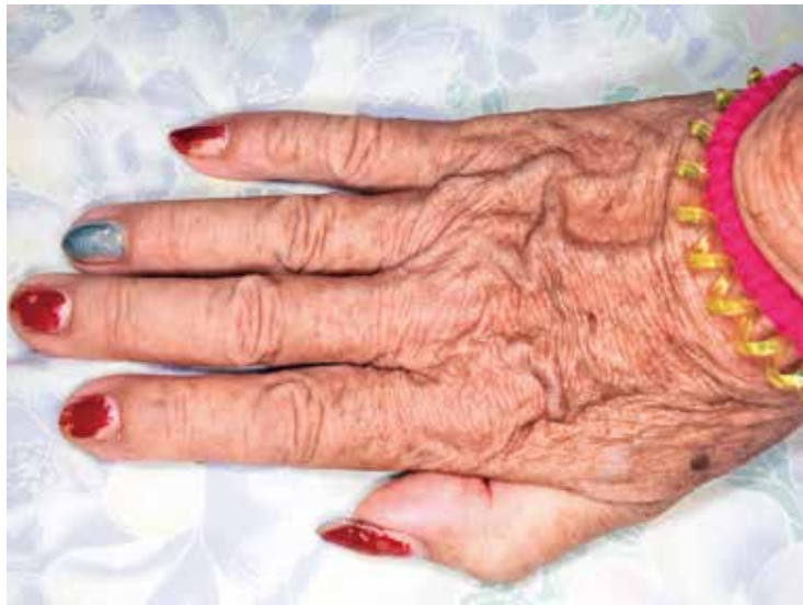
石川竜一《浦添、グッピーの手》 2016年、インクジェット・プリント ©Ryuichi Ishikawa

主な作品発表 「あざみ野フォトアニュアル 考えたときには、もう目の前にはない 石川竜一展」横浜市民ギャラリーあざみ野(2016年)、 「六本木クロッシング2016展:僕の身体、あなたの声」森美術館