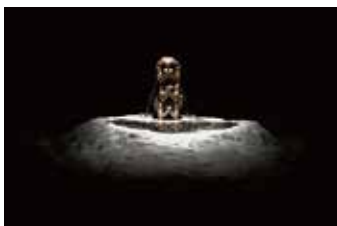
ダミアン・ジャレ | 名和晃平《VESSEL》

ヨーロッパとアフリカ、東南アジア、そして日本。本展出品の6作家の作品には、詩的に、時にユーモア溢れる表現で、身体を通じて立ち現れる歴史と向き合い、未来へ向けて新たな意味を見出していこうとする姿が見えてくることでしょう。