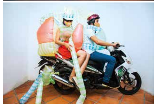
ウダム・チャン・グエン《ヘビの尻尾》より(部分) 2015年、ビデオ・インスタレーション(3面)