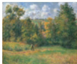
(上) ジュール・バスティアン=ルパーージュ 《干し草》1877年 オルセー美術館