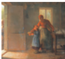
ジャン=フランソワ・ミレー 《施し》 1858-59年 シェルブル=オクトヴィル、 トマ=アンリ美術館 Cherbourg-Octeville, Musée d'art Thomas-Henry

19世紀半ば、現実を生きる民衆の姿をありのままに描き出そうとするリアリズムが勃興した。クールベは、王侯のみが描かれることを許されていた歴史画の大画面に民衆を登場させ、ミレーは額に汗して働く農民の英雄的な姿を描き出し、伝統的な主題に挑んだ。