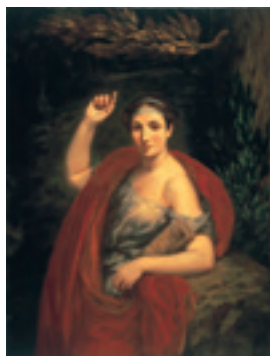
ウジェーヌ・ドラクロワ 《シビュレと黄金の小枝》 1838年 ヤマザキマザック株式会社

普遍的な理想美を追求する新古典主義に対して、何よりも個人の感性を重視したロマン主義が1820-1830年代に台頭してくる。その代表がドラクロワである。色彩を重んじ、筆触の効果を生かした力動感溢れる表現で、文学・東方世界・同時代の事件など、主題の幅も大きく広げ、美の多様性を追求していった。このロマン主義を適度に咀嚼しながら、新古典主義の様式と折衷していった中庸派(ジュスト・ミリュール)と呼ばれる画家たちが、アカデミズム第一世代を形成していく。彼らは、歴史画を親しみやすく、また現実感覚に富んだ手法で描き、歴史的風俗画ともいべき特有の絵画様式を生み出していった。