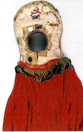
《Frida by Ishiuchi #23》2012年

(Admission until 30 minutes before closing)