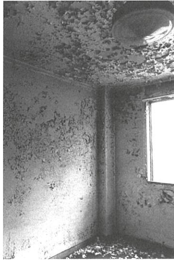
《Bayside Courts #76》1988-89年

石内都は、2014年にアジア人女性として初めてハッセルブラッド国際写真賞を受賞するなど、現在、国際的に最も高く評価される写真家のひとりです。多摩美術大学で織りを学んだ石内は、1975年より独学で写真を始め、思春期を過ごした街・横須賀や、日本各地の旧赤線跡地などを撮影した粒子の粗いモノクローム写真で一躍注目を集めました。近年は、被爆者の遺品を被写体とする「ひろしま」やメキシコの画家フリーダ・カーロの遺品を撮影したシリーズで、その活動は広く知られています。