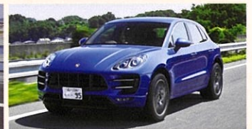
PORSCHE Macan GTS