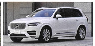
VOLVO XC90 T8 AWD inscription