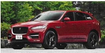
JAGUAR F-PACE 35t R-SPORT