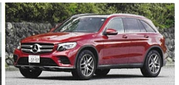
Mercedes-Benz GLC 250 4MATIC Sports