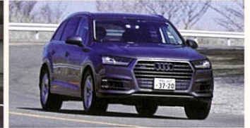
Audi Q7 3.0TFSI quattro