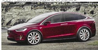
TESLA Model X