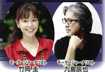
モータージャーナリスト 竹岡 圭