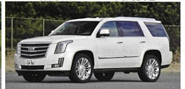
CADILLAC ESCALADE Platinum