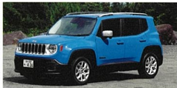
JEEP Renegade LIMITED