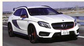
Mercedes-AMG GLA 45 4MATIC