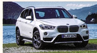
BMW X1 xDrive 18d