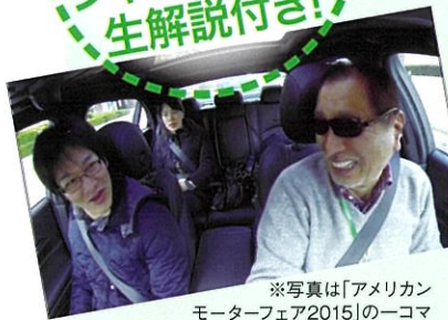
※写真は「アメリカン モーターフェア2015」のこコマ