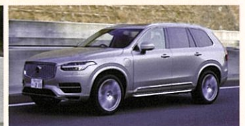
VOLVO XC90 T6 AWD inscription