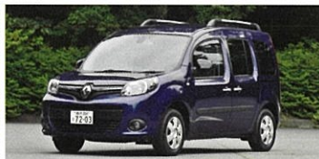
Renault KANGOO ZEN 6DCT