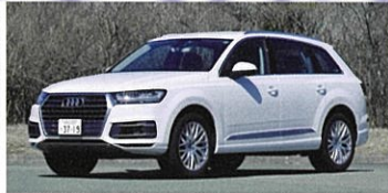
Audi Q7 2.0TFSI quattro