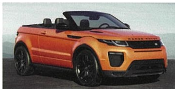
LANDROVER RANGE ROVER EVOQUE CONVERTIBLE HSE DYNAMIC