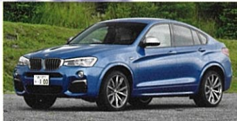
BMW X4 M40i