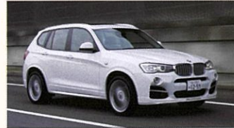
ALPINA XD3 BITURBO Allrad