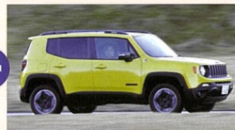
JEEP Renegade TRAILHAWK