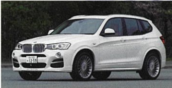
ALPINA XD3 BITURBO Allrad