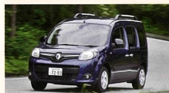
Renault KANGOO ZEN EDC