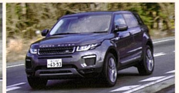
LANDROVER RANGE ROVER EVOQUE