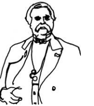
初代駐日アメリカ総領事 ハリス

蒸気（スチーム）の力は世界の様子をすっかり変えてしまった。日本は鎖国をやめるべきだ。18年前、中国はイギリスと戦争をした。負けた中国は港をイギリスに明け渡し、領土も取られた。 今、イギリスはまた中国に戦争を仕掛けようとしている。やがて、日本人が見たこともないほどの軍艦を率いて日本にやってくるのだ。その時になってからでは遅い。今、この私と条約を結びなさい。