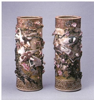
初代 宮川香山「高浮彫桜二群鳩大花瓶」明治前期 陶磁器、一对 田邊哲人コレクション(神奈川県立歴史博物館寄託)