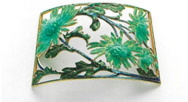
ルネ・ラリック「チョーカーヘッド(菊)」1900年頃 金、エマイユ 箱根ラリック美術館蔵