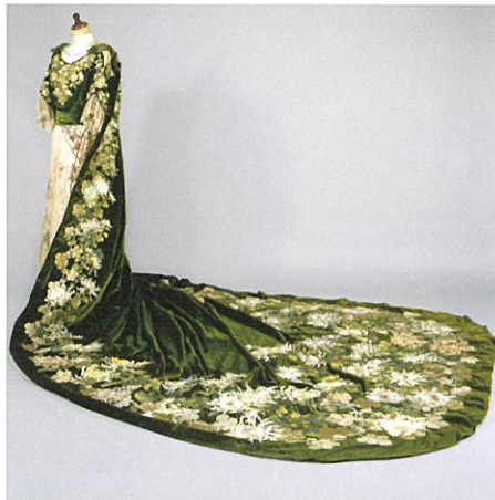
「昭憲皇太后着用大礼服」1910年頃(明治末期) 共立女子大学博物館蔵