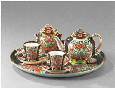
ロイヤル・ウスター社「伊万里写ティーセット」1881年 磁器 三菱一号館美術館蔵