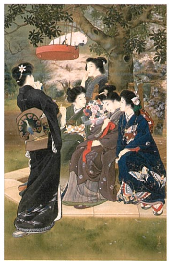
錦木清方「嫁ぐ人」1907(明治40)年 絹本着色、一幅 鎌倉市錦木清方記念美術館蔵 *5月20日からの展示