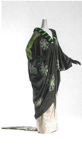
エイミー・リンカー「コート」1913年頃 KCI蔵