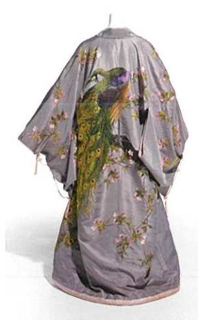
飯田高島屋「室内着」1906(明治39)年頃 KCI蔵