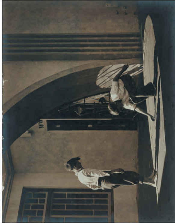
図版3 福山秀治《ミルク瓶のふた》1930-35(昭和5-10)年頃、26.7×34.2cm Hideharu Fukuyama, Milk Tops , ca. 1930-35