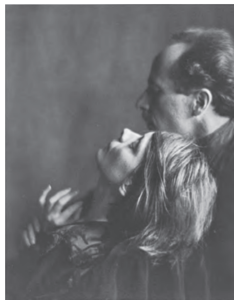
挿図8 イモーゲン・カニンガム《エドワード・ウェストンとマーガレット・マーザー》1923(大正12)年(後年のプリント)、横浜美術館蔵