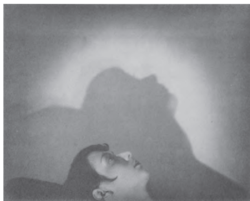
挿図10 下津佐正志《オーロラ》1927(昭和2)年頃、横浜美術館蔵