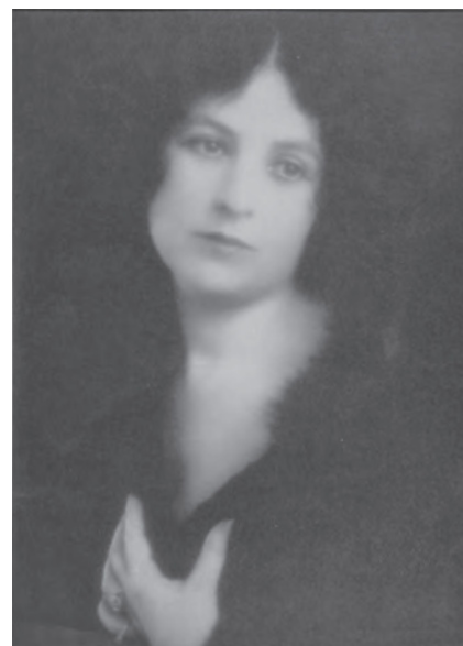
挿図6 下津佐正志《婦人》1927(昭和2)年、横浜美術館蔵

またもうひとり、年表のなかで登場するアメリカ人写真家マーガレット・マーザー(1886-1952)も、当時の在米日本人と白人写真家のコミュニティをつないだ人物として注目したい。マーザーは、孤児で