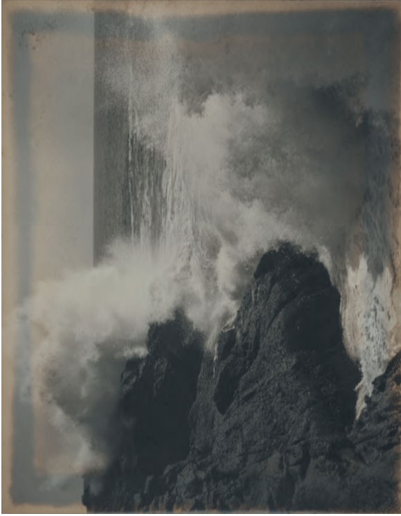
図版2 河野浅八《無益な猛り》1932(昭和7)年、26.3×33.7cm Asahichi Kono, Futile Rage , 1932