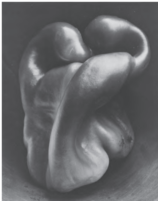
挿図4 エドワード・ウェストン《ペッパーNo.30》1930(昭和5)年(1981年プリント)、横浜美術館蔵