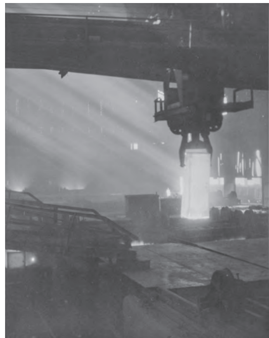
挿図5 ハリー・K・シゲタ《Soak Pit》1935(昭和10)年頃、横浜美術館蔵(トム・ジェイコブスン氏寄贈)