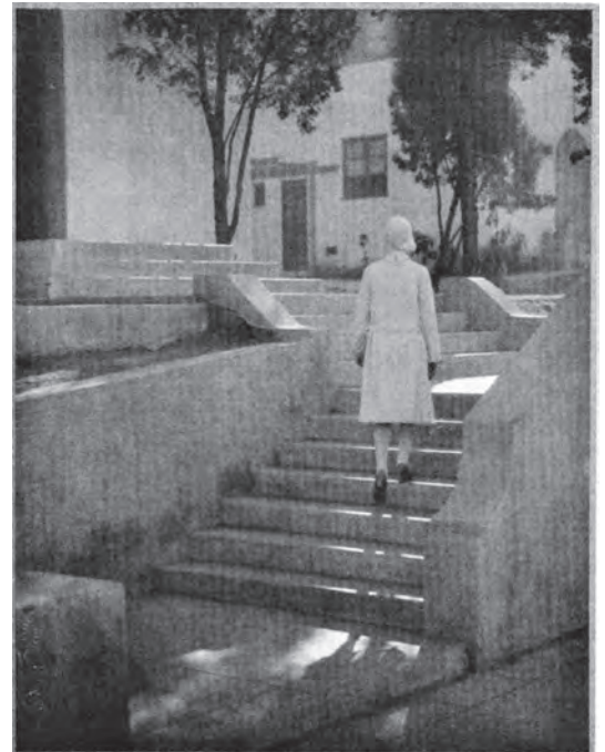
挿図3 福山秀治《歸家》1931(昭和6)年頃、所在不明(『第5回国際写真サロン』p.189より引用)

いずれにしても、福山についてはまだ不明な点が多く、引き続きの調査が必要である。以上の経緯を記したうえ、本稿では河野、そして福山を知るための基礎的な資料と