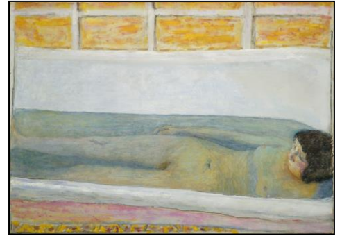
ピエール・ボナール 《入浴》 1925年 油彩/カンヴァス Tate: Presented by Lord Ivor Spencer Churchill through the Contemporary Art Society 1930