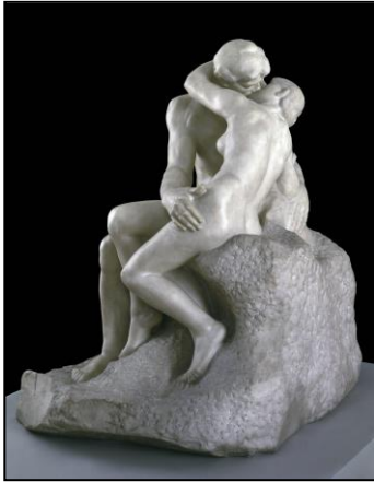
オーギュスト・ロダン 《接吻》 1901-4年 ペンテリコン大理石 Tate: Purchased with assistance from the Art Fund and public contributions 1953