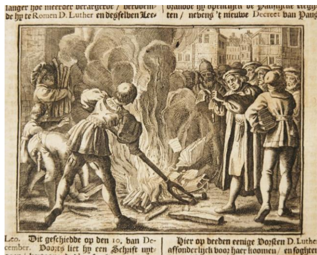
上: マテウス・メリアン (1593-1650) 《教会法を焼き捨てるルター博士》 銅版画、10.1 × 13.8cm 『史的年代記』より