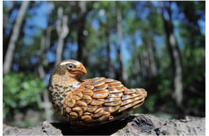
高円宮妃殿下ご撮影『青嵐』(三代宮澤良舟 象牙 1989 3.8cm)