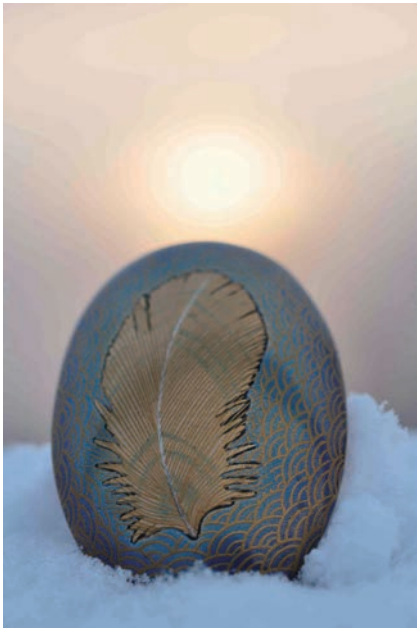
高円宮妃殿下ご撮影『イカロスの翼』 (針谷絹代 蒔絵 2007 5.3cm)