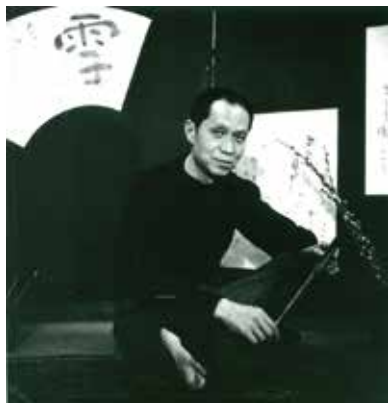
長谷川三郎、1956年頃

画家長谷川三郎は1906年山口県豊浦郡（現・下関市）に生まれる。青年期を芦屋で過ごし、甲南高等学校在学中には小出楯重 こいでなるしげ の下に通い油彩画を学ぶ。東京帝国大学に進学し、美術史を専攻。卒業論文では雪舟を論じた。