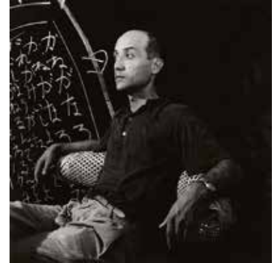
イサム・ノグチ、1950年