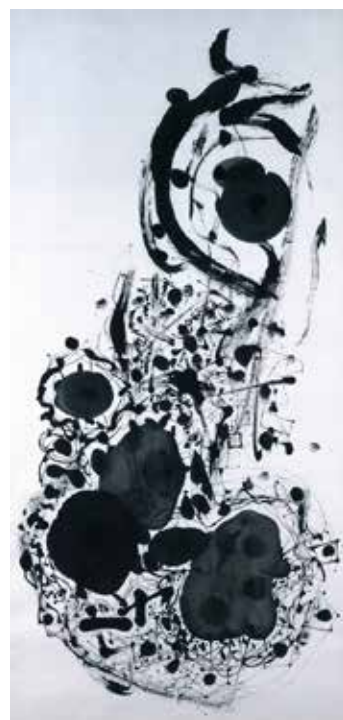
長谷川三郎《無題》1954年 紙本墨、138.8×70.0cm、 学校法人甲南学園 長谷川三郎記念ギャラリー蔵

また、1950年代にノグチがアメリカと日本を往復しながら制作した陶、石、アルミニウム、鉄、鐘青銅、バルサ材による彫刻、数々の「あかり」などの作品には、ノグチが長谷川とともに日本で見た古い文化遺産や、長谷川との対話を通して深めた禅や東洋思想への理解が本質となって現れていると言えます。小さな陶の《顔皿》から等身大を超えるアルミ板の《雪舟》、哲学的なタイトルをもつバルサ材の《死すべき運命》、そして高さ2.6mの石彫《庭の要素》まで、素材も規模も様々な作品群は、スタイルや表層的な日本趣味とは異次元の、時代や文化の違いを超えた世界美術に向けたノグチの挑戦といえるでしょう。今日わたしたちが抱くノグチ芸術のイメージの基本はこの時期に形作られたといっても過言ではありません。