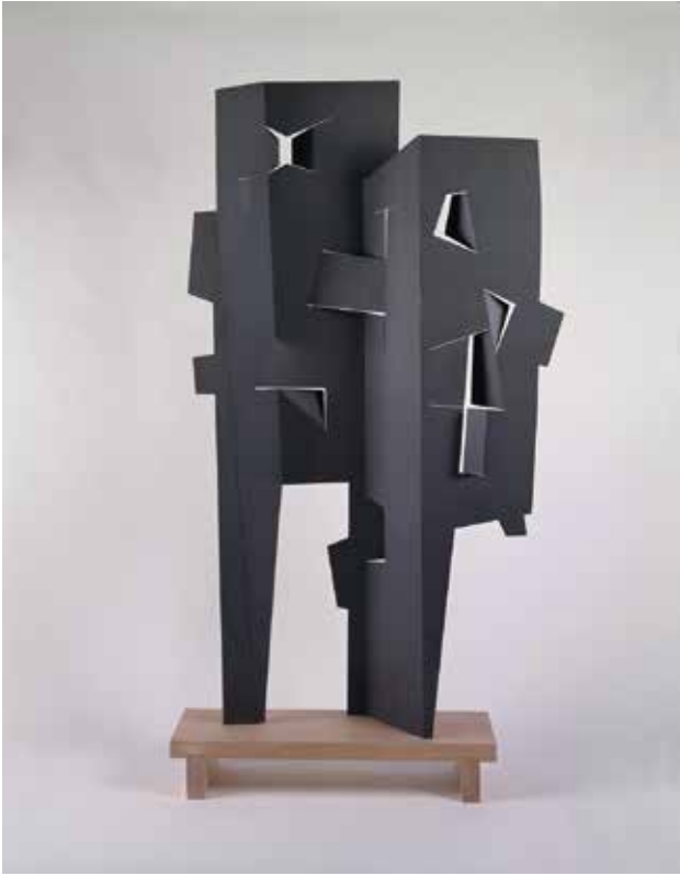
イサム・ノグチ《能楽師たち》1958年 アルミニウム、塗装、178.4×99.1×19.7cm イサム・ノグチ財団・庭園美術館（ニューヨーク）蔵 ©The Isamu Noguchi Foundation and Garden Museum, New York/ARS-JASPAR